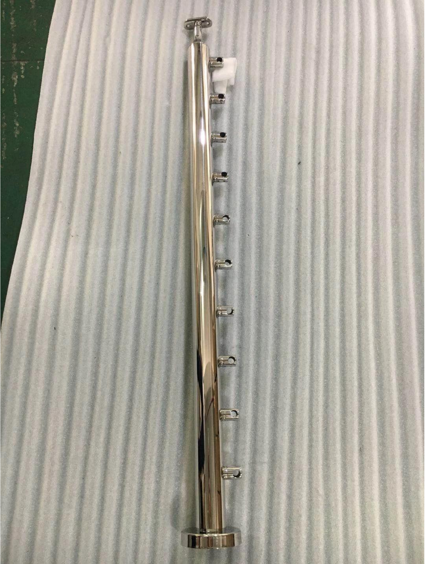
- (أسفل الفولاذ المقاوم للصدأ حديدي آخر العارضة (يمكن أن يكون مع أو بدون قاعدة ملحومة 316