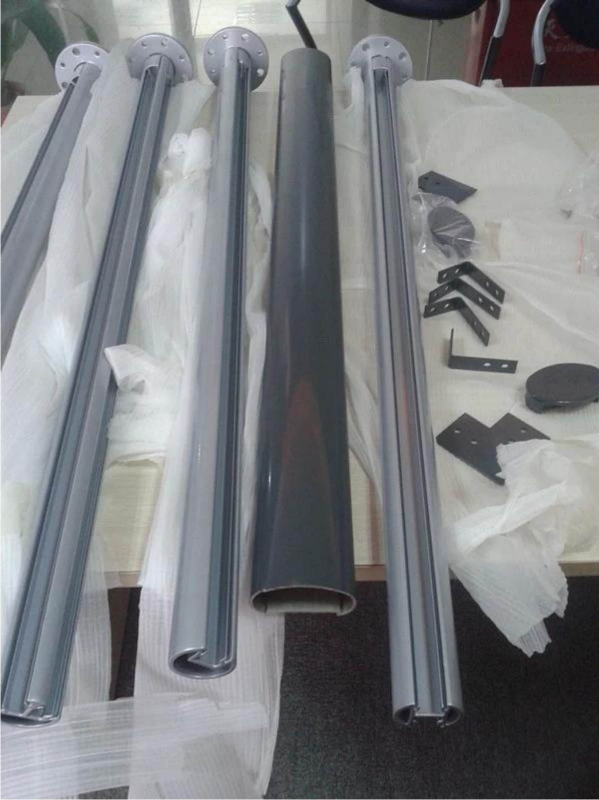
4. الألومنيوم لدرايزين الزجاج T5 مسحوق الطلاء 6063.