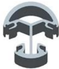
Round 2 way 135 degree