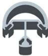
Round 2 way 90 degree