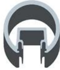
Round 1 way