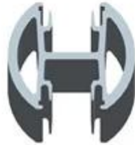
Round 2 way 180 degree