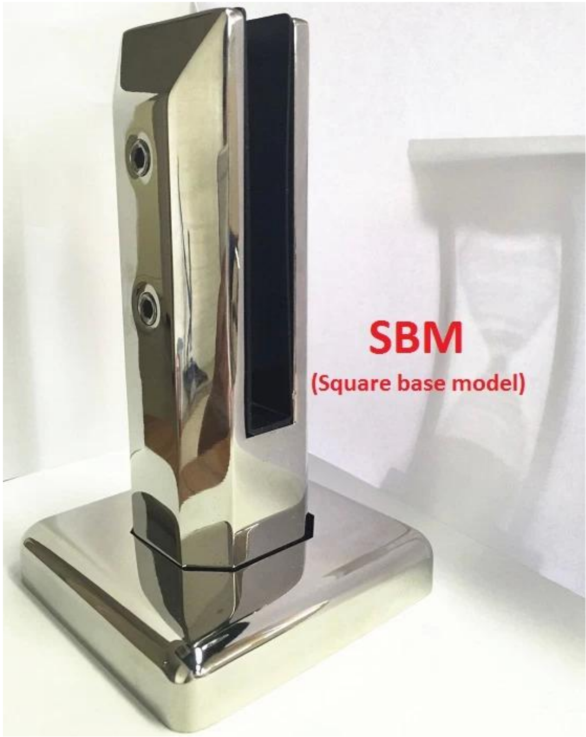
SBM (Square base model)