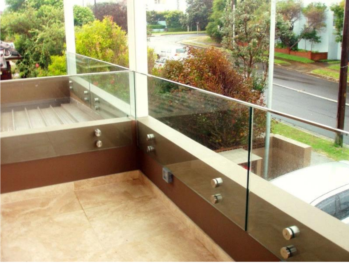
المواجهة زجاج نظام حديدي داخلي تصميم الدرج. 2).