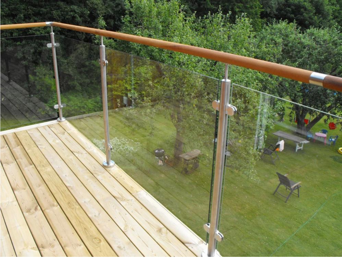
شرفة في الهواء الطلق الزجاج حديدي