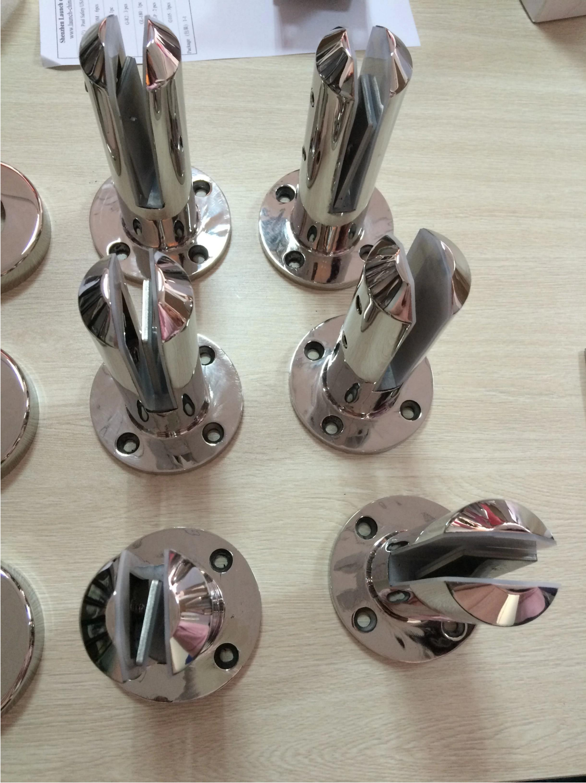
3). جولة لوحة قاعدة الصورة حنفية التعبئة.