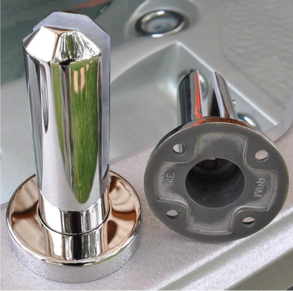
قاعدة مستديرة لوحة حنفية الصورة السلع كتلة. 2)