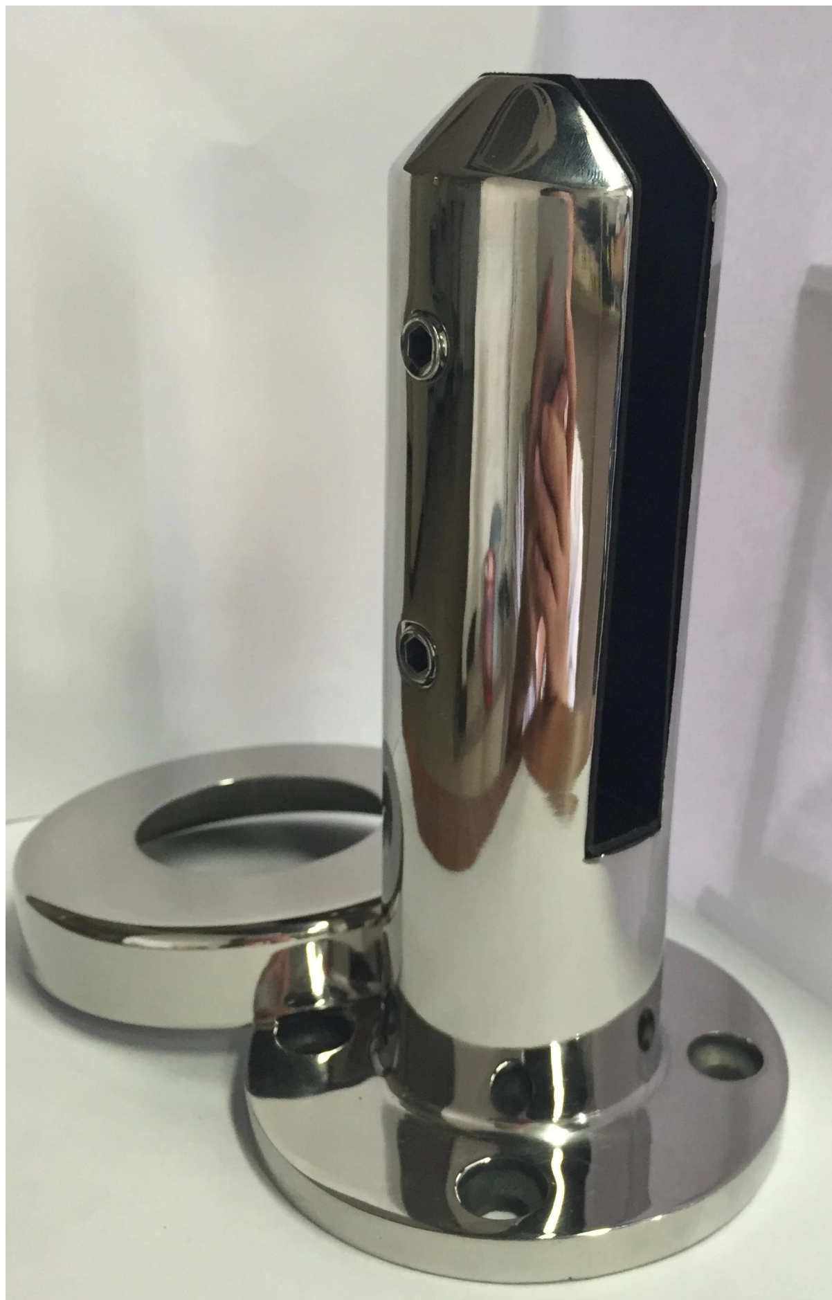
RCM-2: نموذج رقم