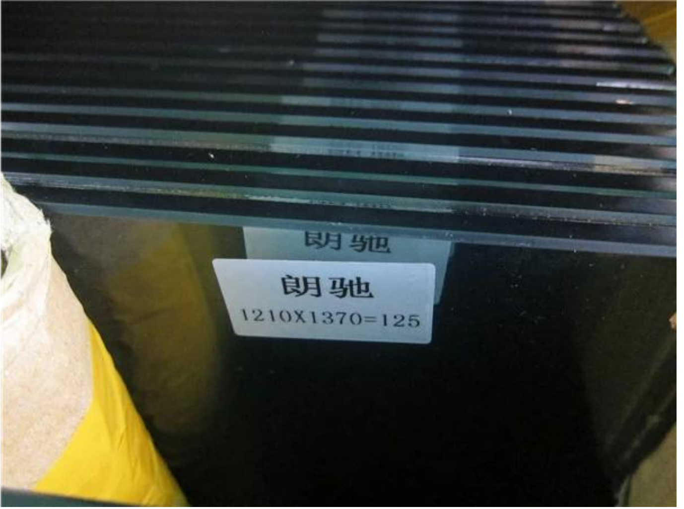
-زجاج فائق الوضوح