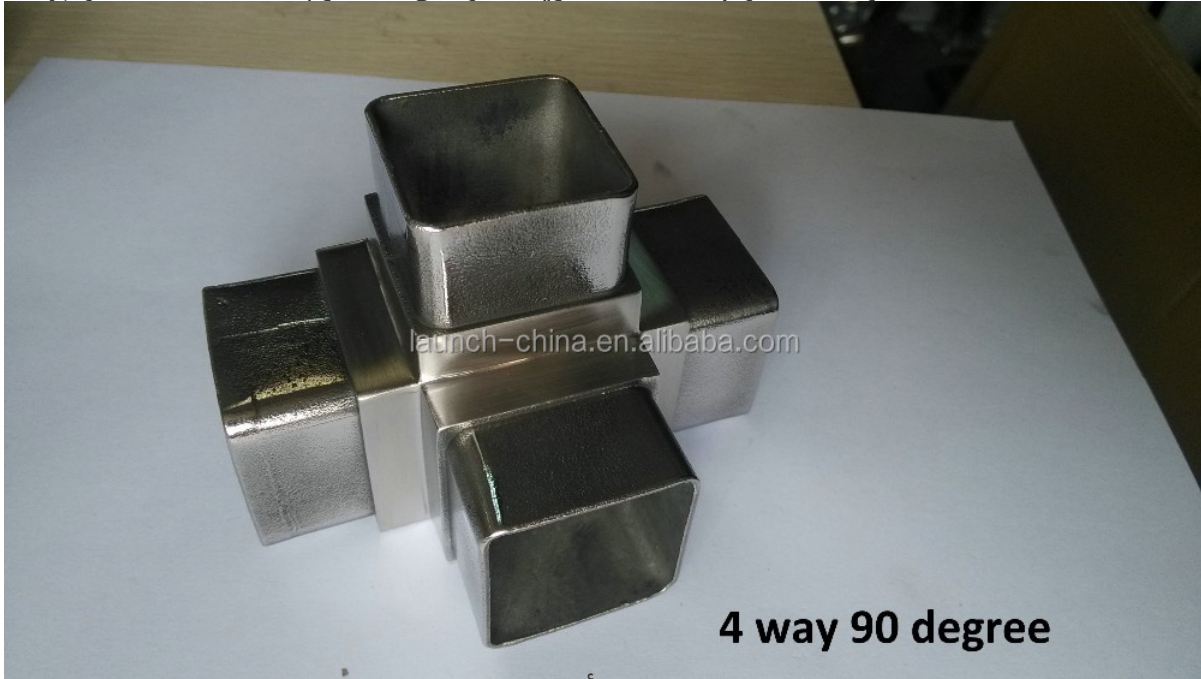
4 way 90 degree

الفولاذ المقاوم للصدأ 4 طريقة موصل 90 درجة No.S404 نموذج 4.