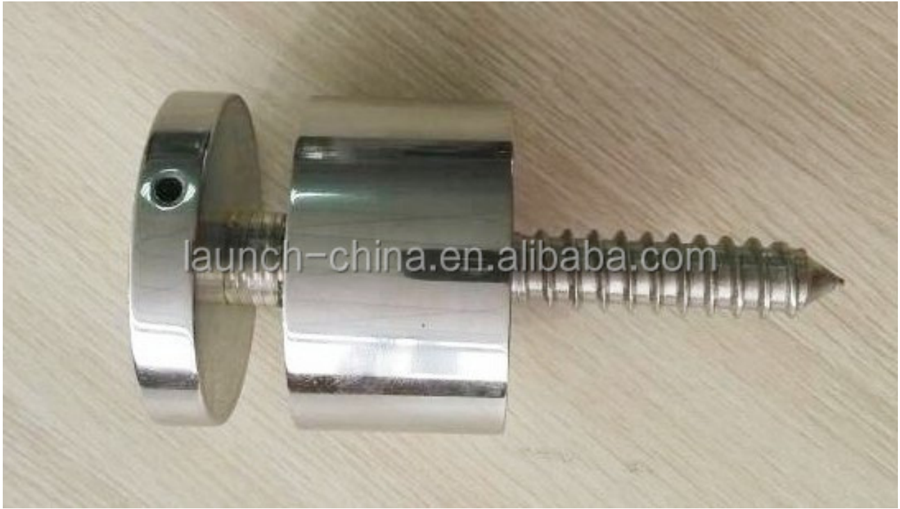
لوحه زجاج تصاعد بين قوسين SF-50 نموذج رقم 2.