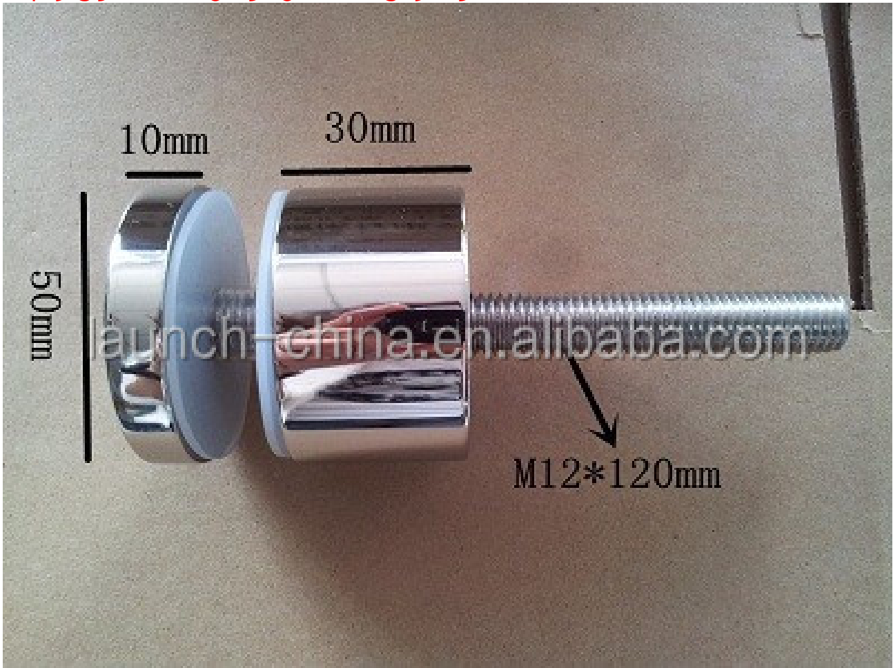
لوحه زجاج تصاعد بين قوسين SF-50T نموذج رقم 3.