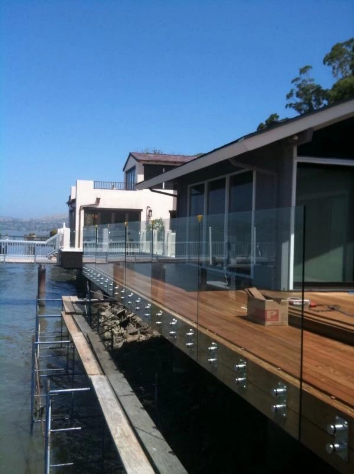
تصميم الزجاج حديدي taircaseالصلب لوحة تركيب الزجاج الصورة Stainless. بين قوسين 2)