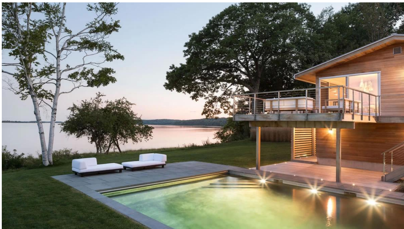
Edelstahl-Kabelgeländersystem, Kabelgewinde mit Innengewinde, Drahtseilgeländer für Balkon und Treppe