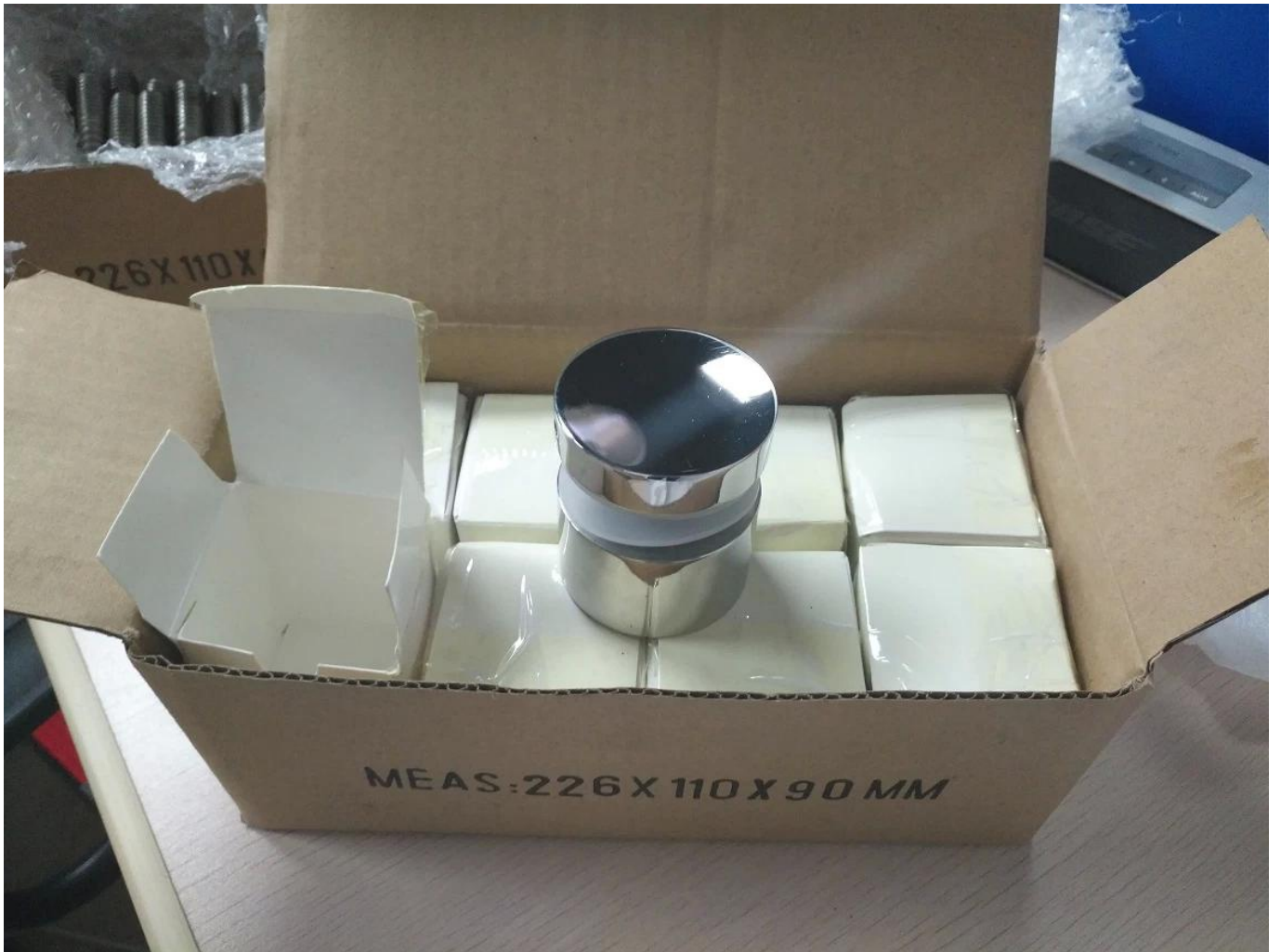
MEHR GLAS STANDOFF DESIGNS: