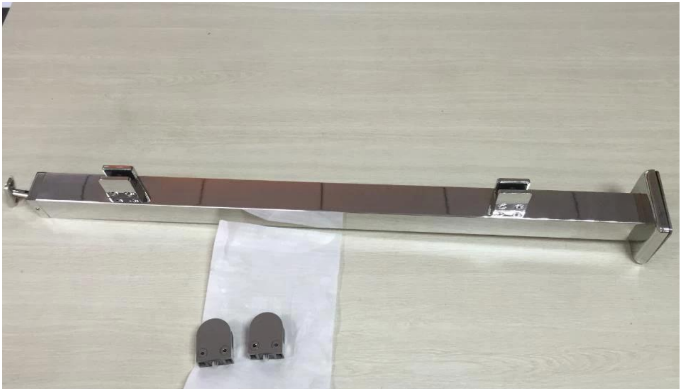
Glasklemme an Betonwänden montiert-