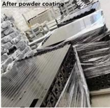
After powder coating