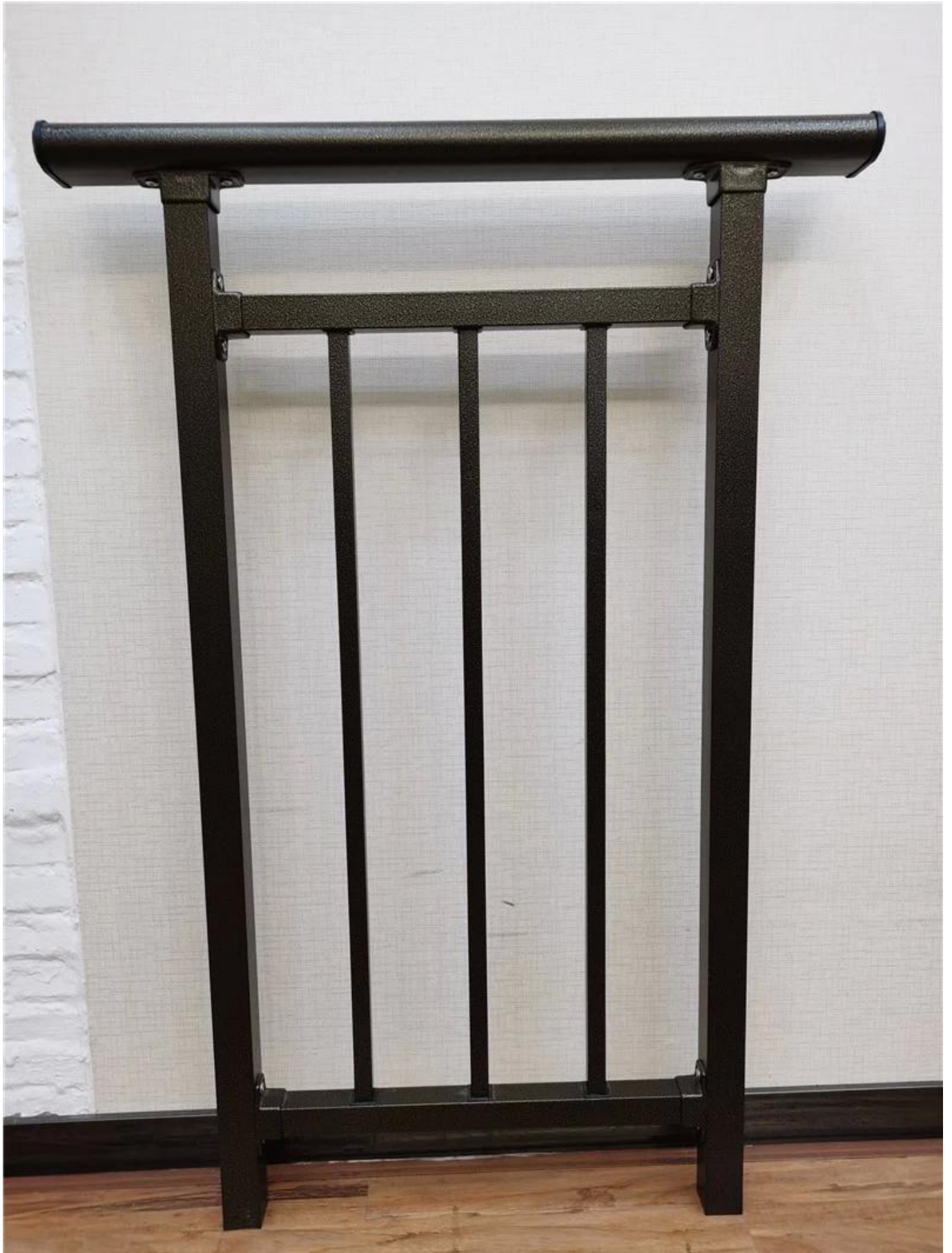
Weitere Designs aus Stahl Handläufe, Mit nur einem mittleren Balken-