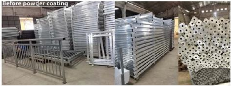
Before powder coating