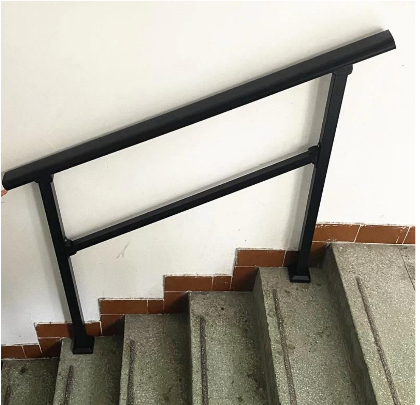
Produktionsfotos von Zinkstahlzaun-