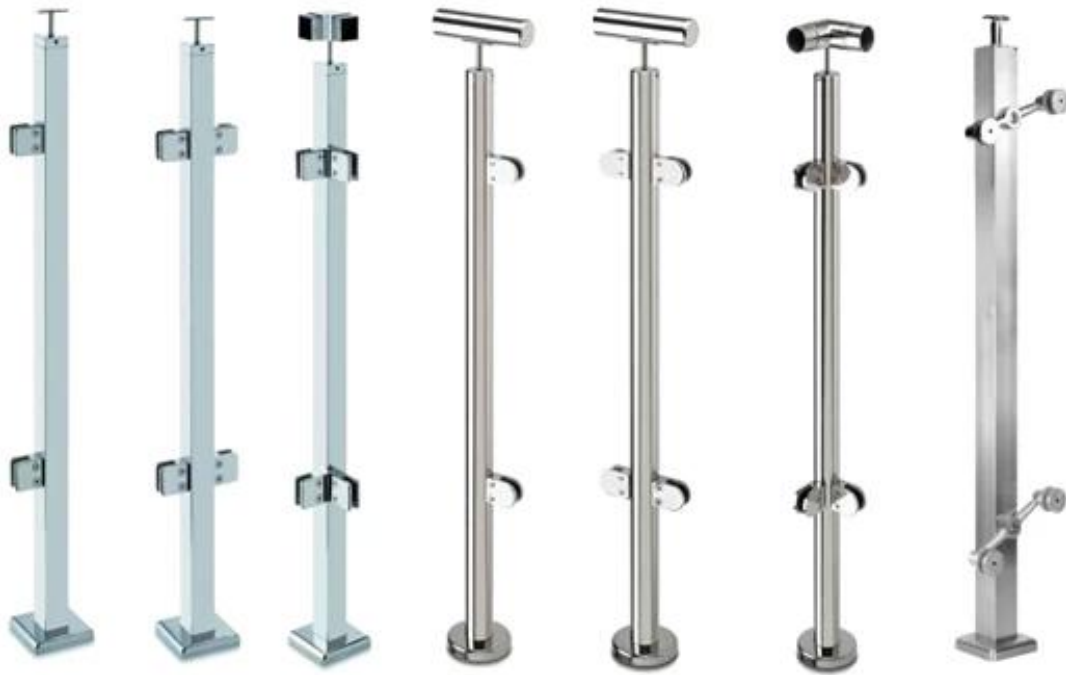
Edelstahl Geländer Handläufe Projekte Fotos