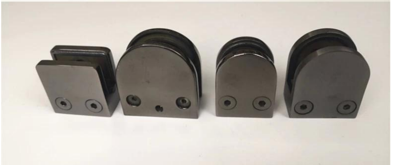
Verschiedene Arten von Glasklemmen mit Abmessungen: