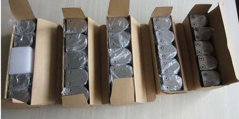
3 □ Projektfotos von gebürsteten quadratischen Pfosten-Edelstahl-Glasklemmen für 8-10 mm Glas