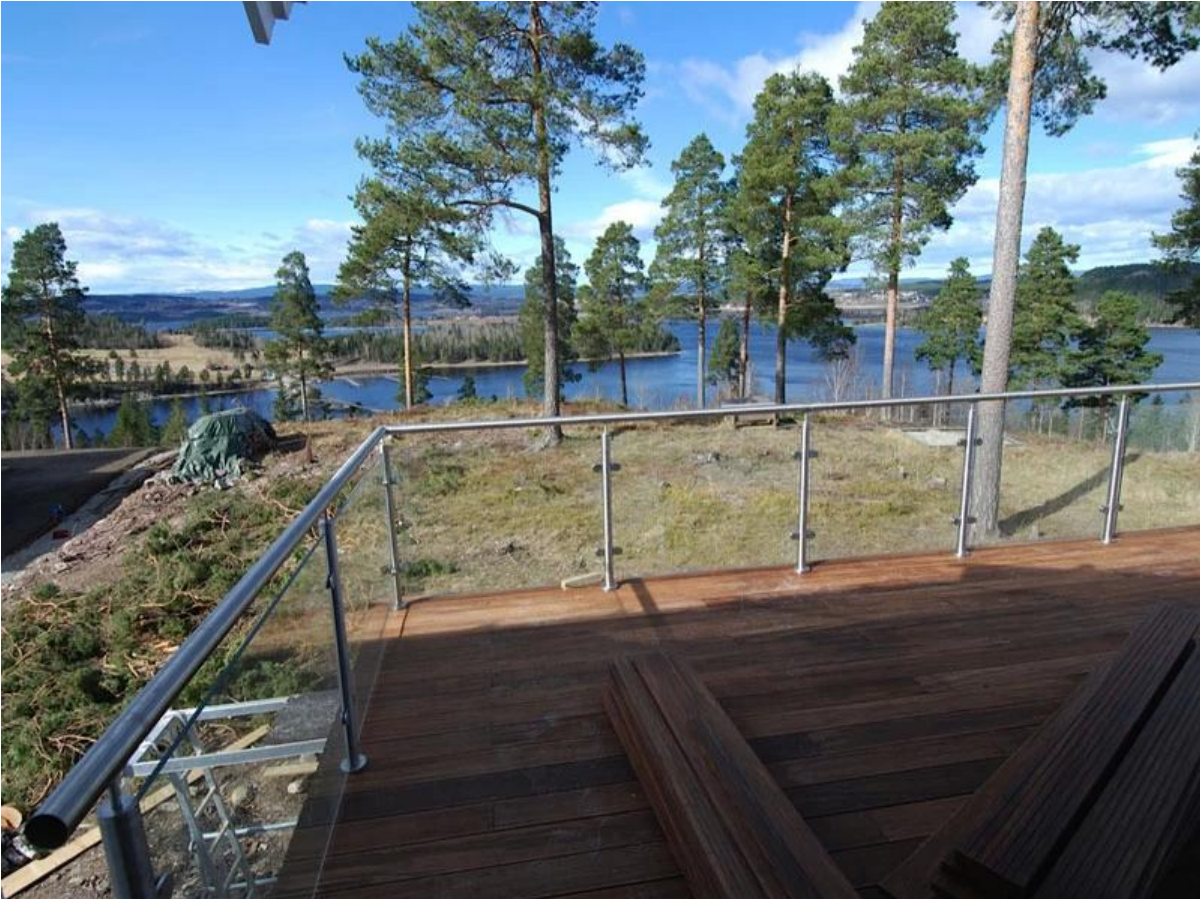
Edelstahlgeländer mit Glas