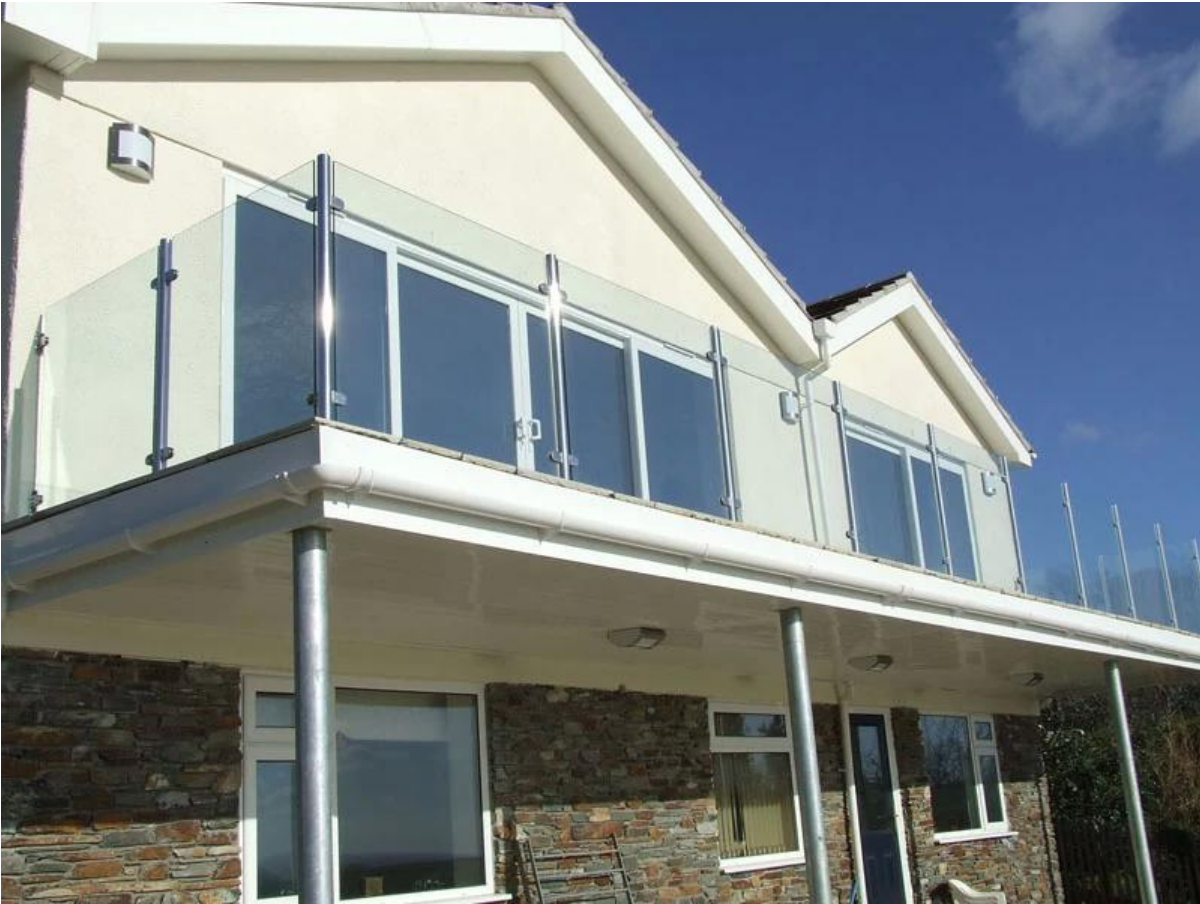
Glas Balkon Geländer Foto.