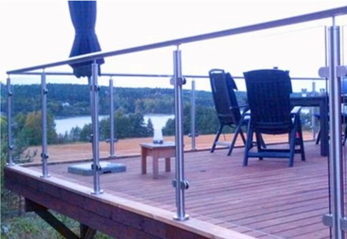
Balkongeländer aus Glas