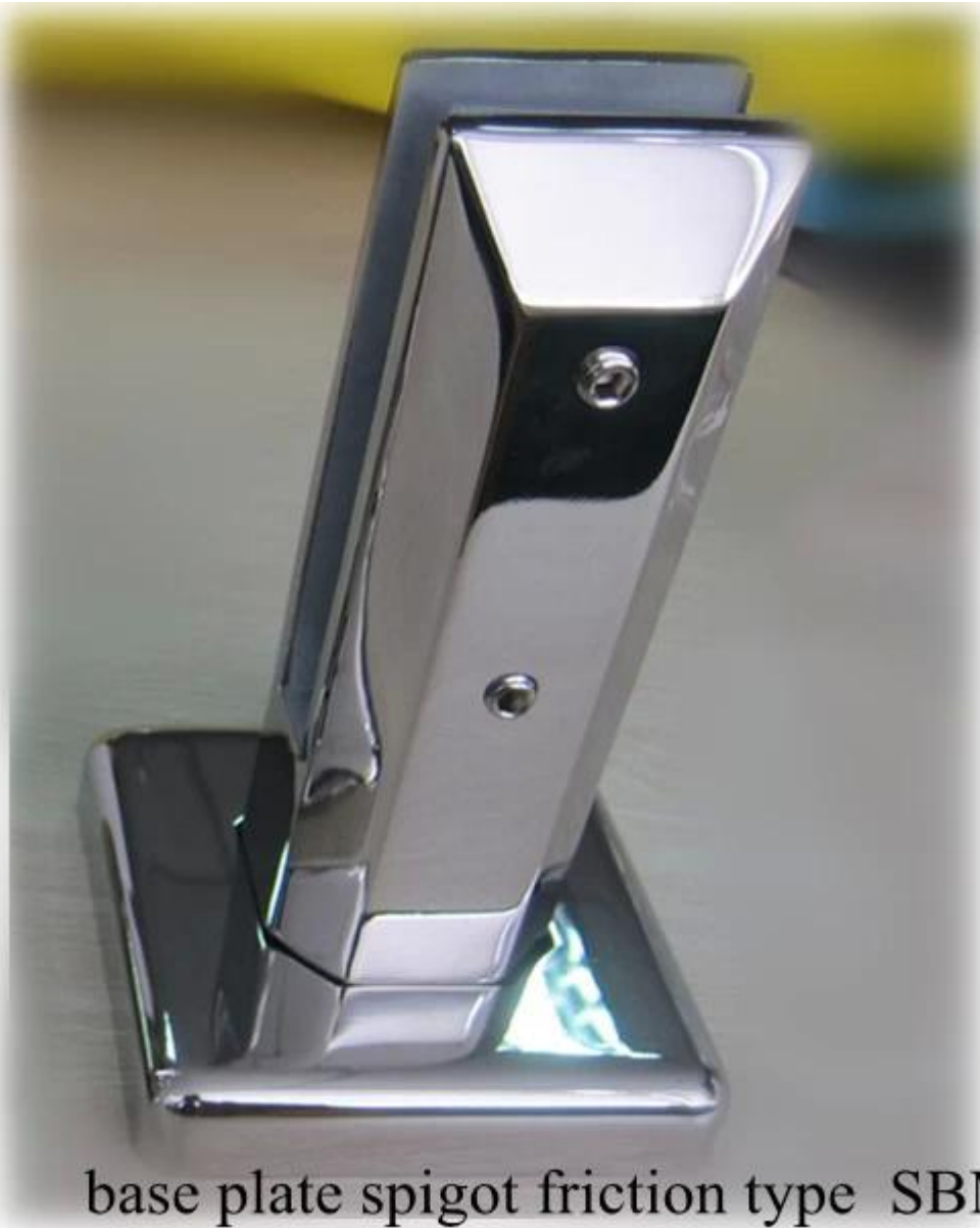
base plate spigot friction type SBM