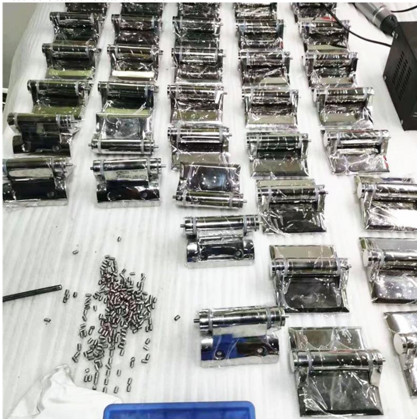
Projektfotos von Schwimmbadzaun-