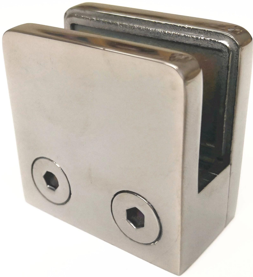
II. Produktion & Verpackung Einzelheiten von D Form Glasklemme