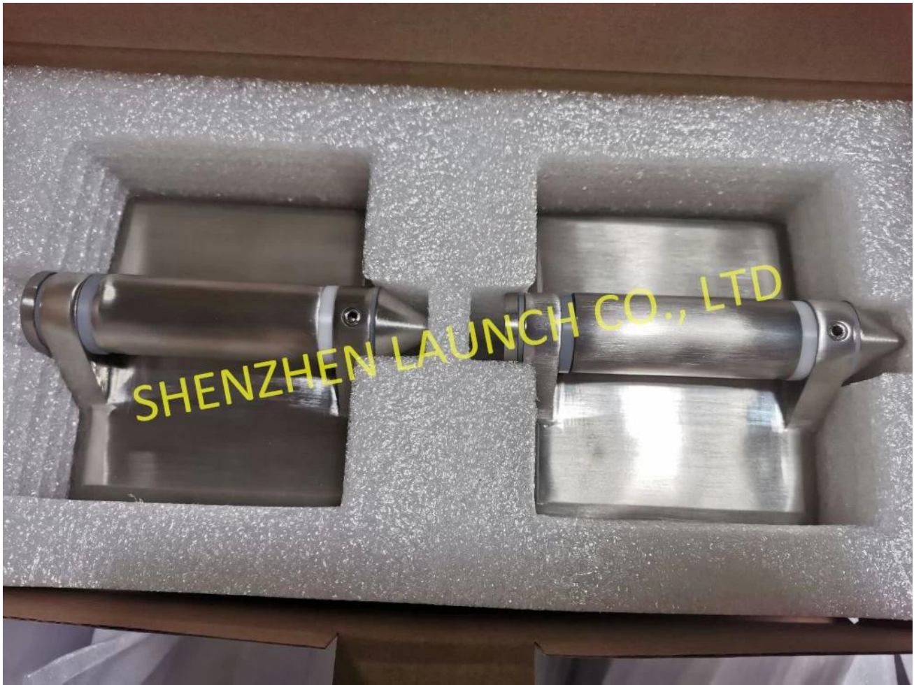
Glas-an-Glas-Pfostenscharnier, mit flacher Kappe an den Enden