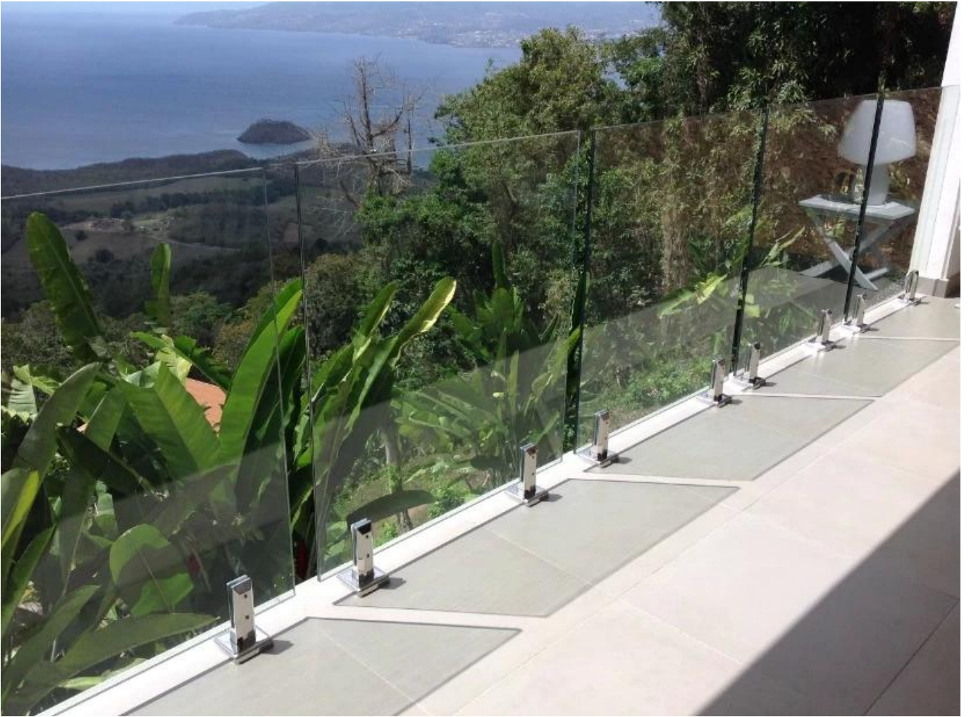
SBM in Satin-Finish: