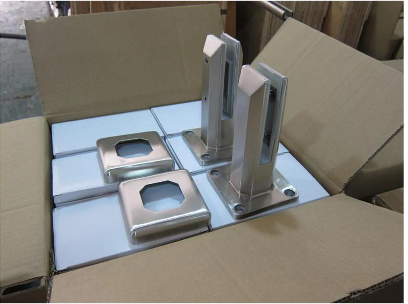
Projektfotos: SBM im Spiegel-Finish: