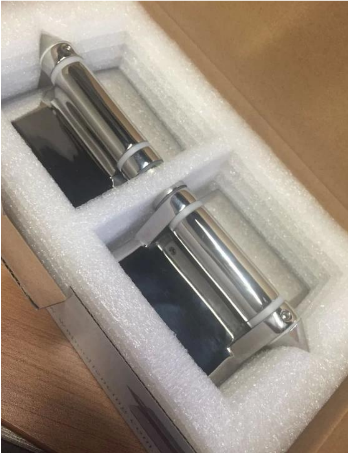
Die linke ist Modell Nr. G-G2 und die rechte ist G-G: