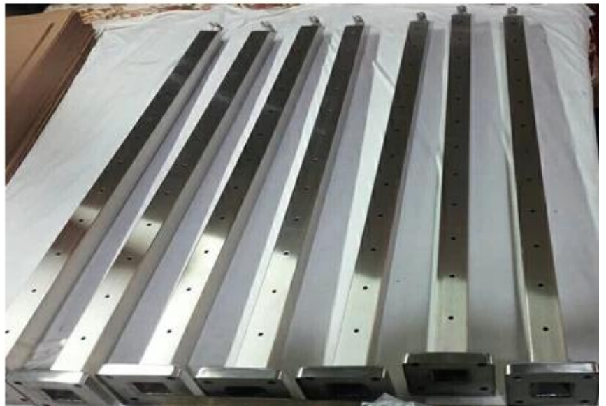
ProfijctFotoszumInox Edelstahl Balustrade Pfosten Kabel Geländer Drahtseil Geländer