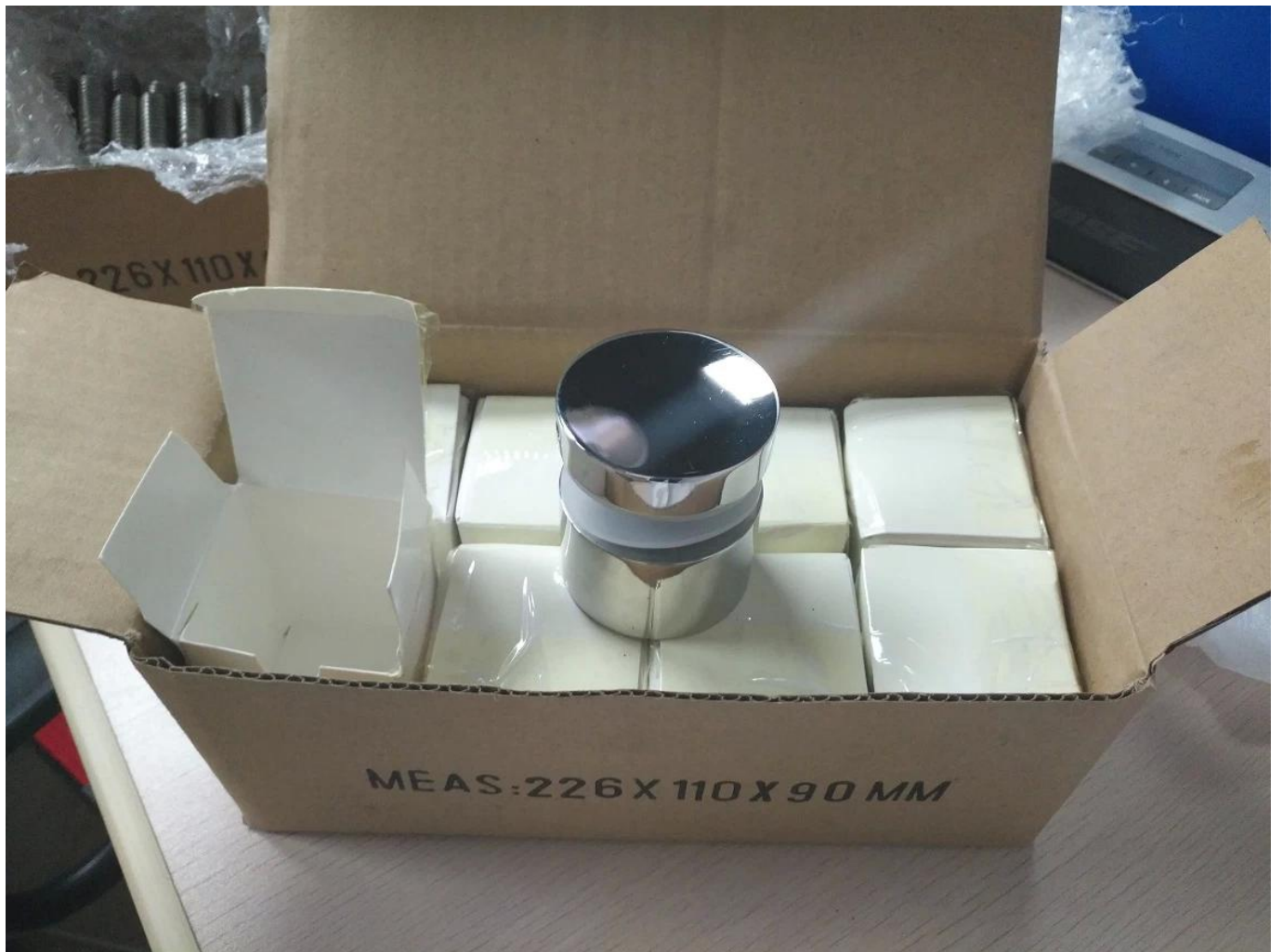
MEHR GLAS STANDOFF HALTERUNGSDESIGNS: