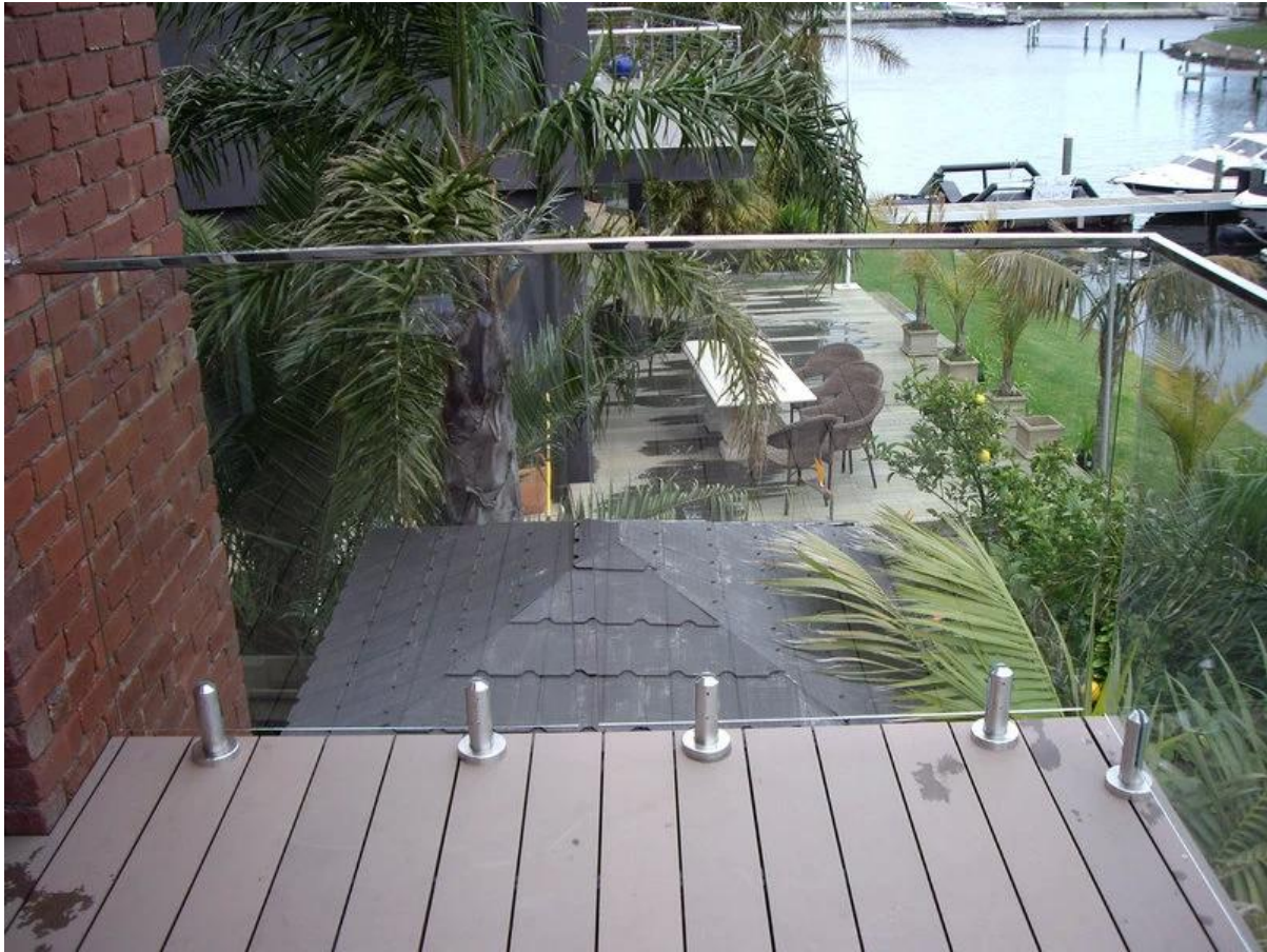
Schwimmbad Zaun, schützen Sie Ihre Kinder