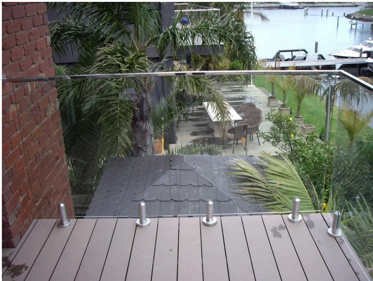
Schwimmbad Zaun, schützen Sie Ihre Kinder