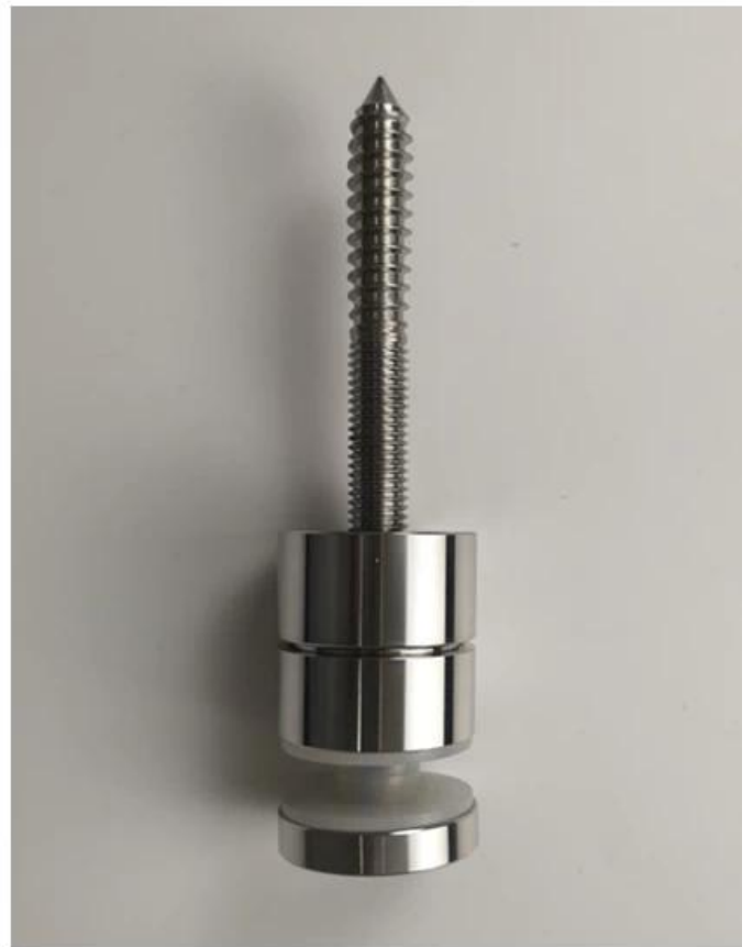
Andere Modelle von Glasabstand wie unten-