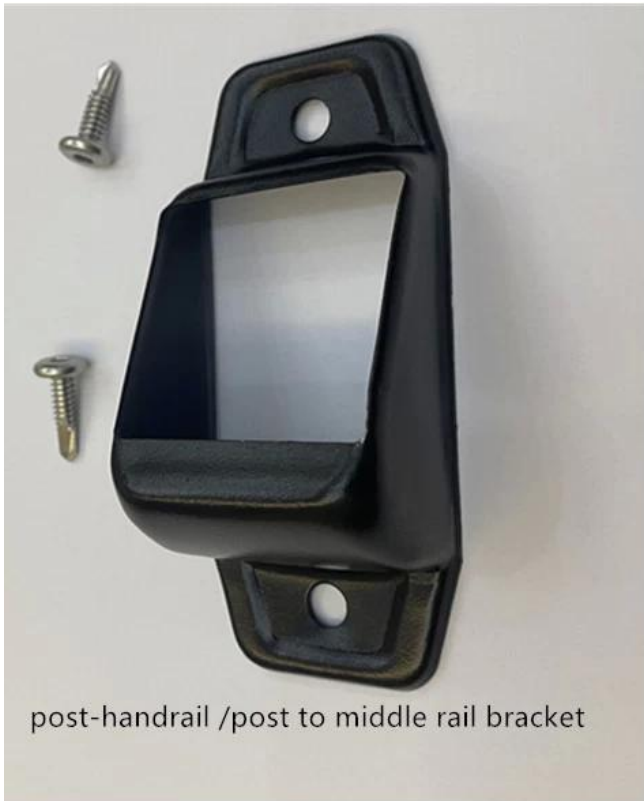
post-handrail /post to middle rail bracket