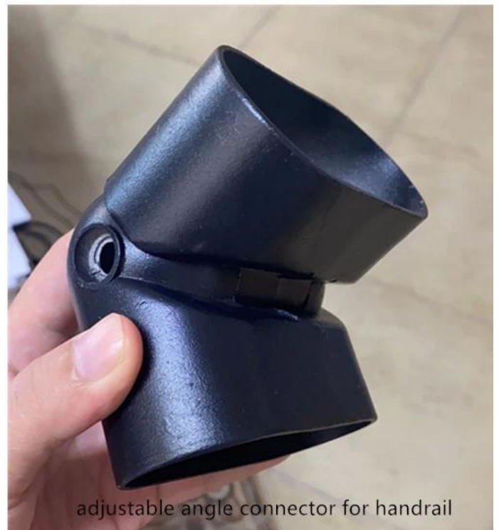
adjustable angle connector for handrail