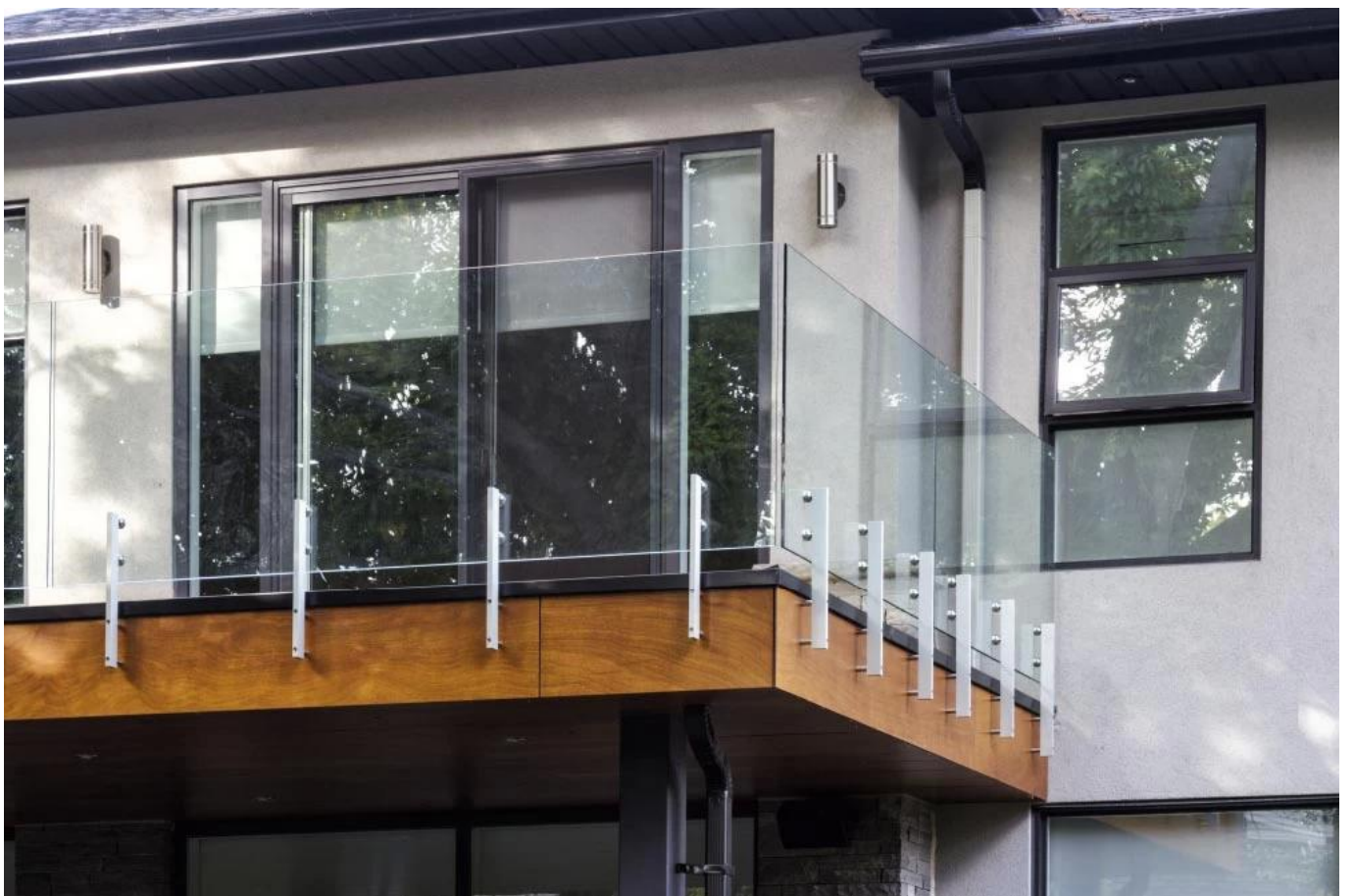
Top Mount Mini Post / Clear oder Black Elooxidized Mini Post / Edelstahlabstand