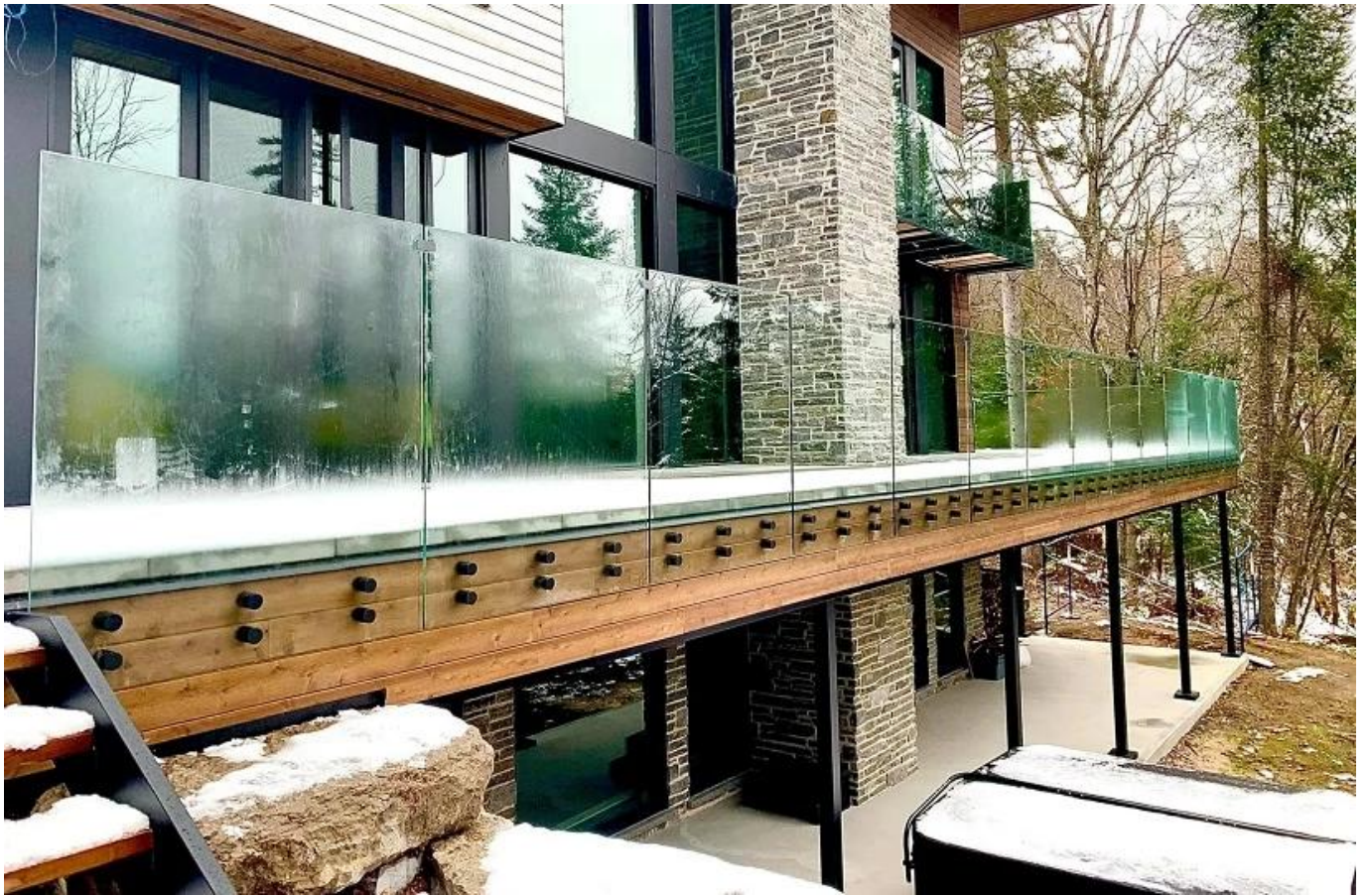
Andere Modelle von Glasabstand wie unten-