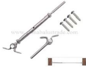
T806- 4mm cable