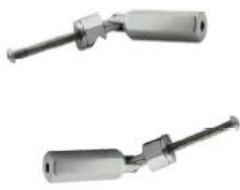
T801- 3mm/4mm cable