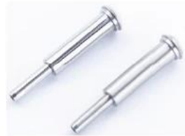
T807- 3mm/4mm cable