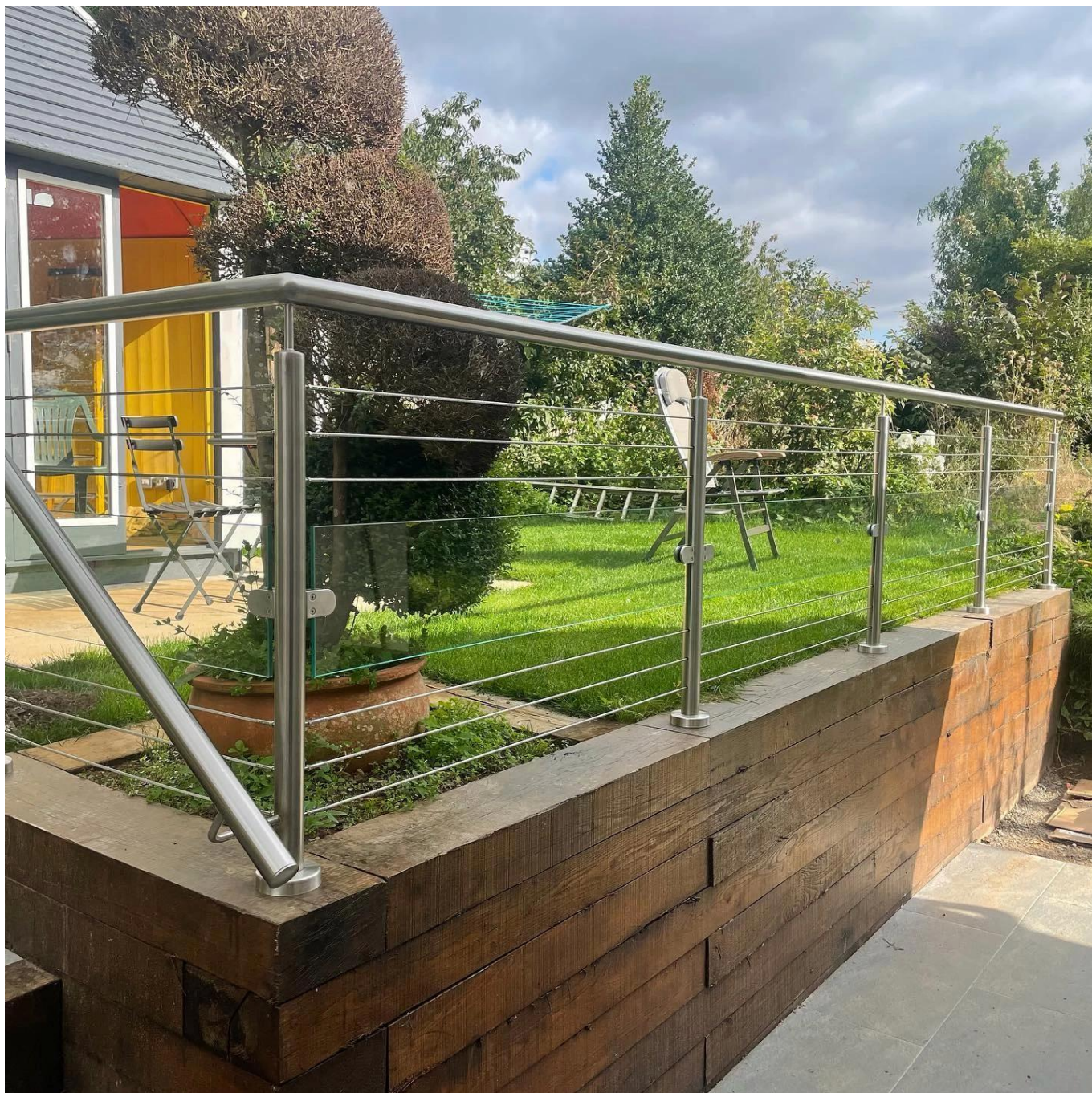
Kabel-ausgerinter Edelstahl-Balustrade-Post mit Edelstahl-Handlauf für Modell-Treppen-Geländer-Design