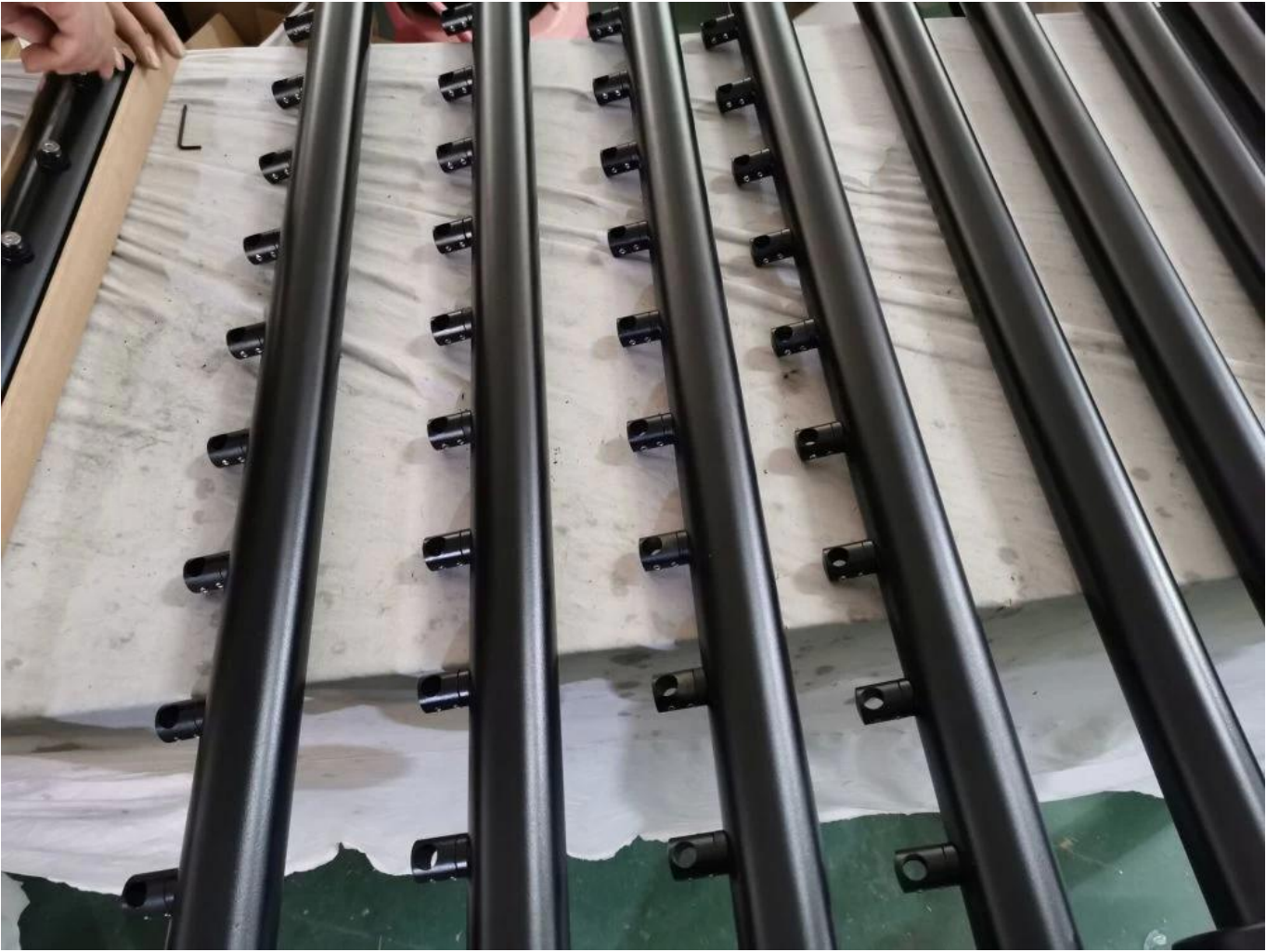
6 Projektfotos für EdelstahlstangengeländersystemCROSSBAR HALTER BAR-Stecker