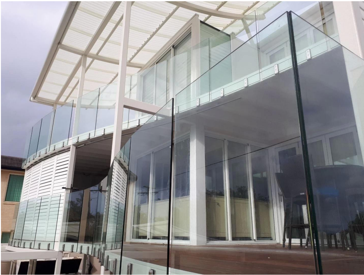
Rahmenlose Frontscheiben-Glaszapfenklemme mit Sicherheitsverpackung