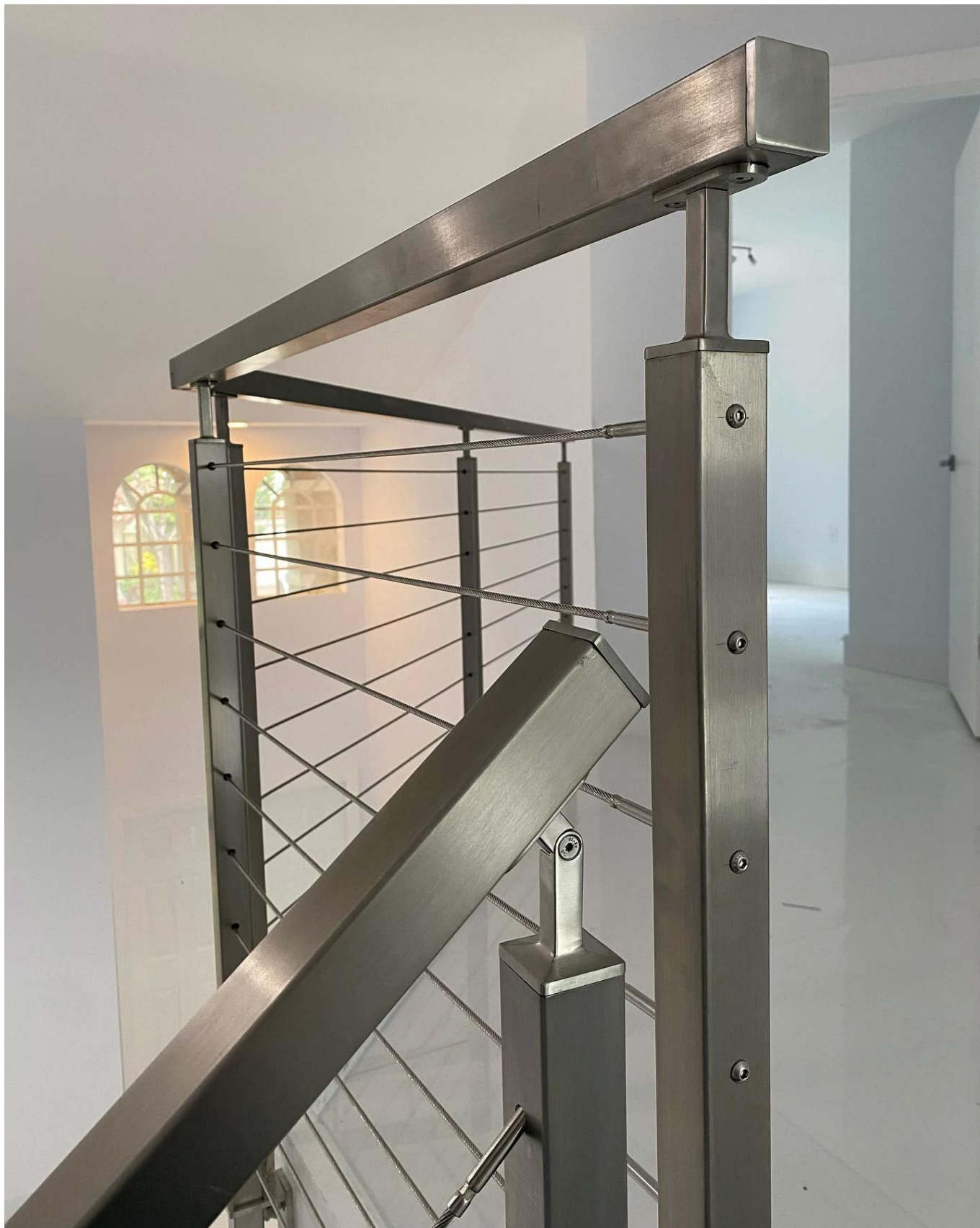
Kabel-ausgerinter Edelstahl-Balustrade-Post mit Edelstahl-Handlauf für Modell-Treppen-Geländer-Design