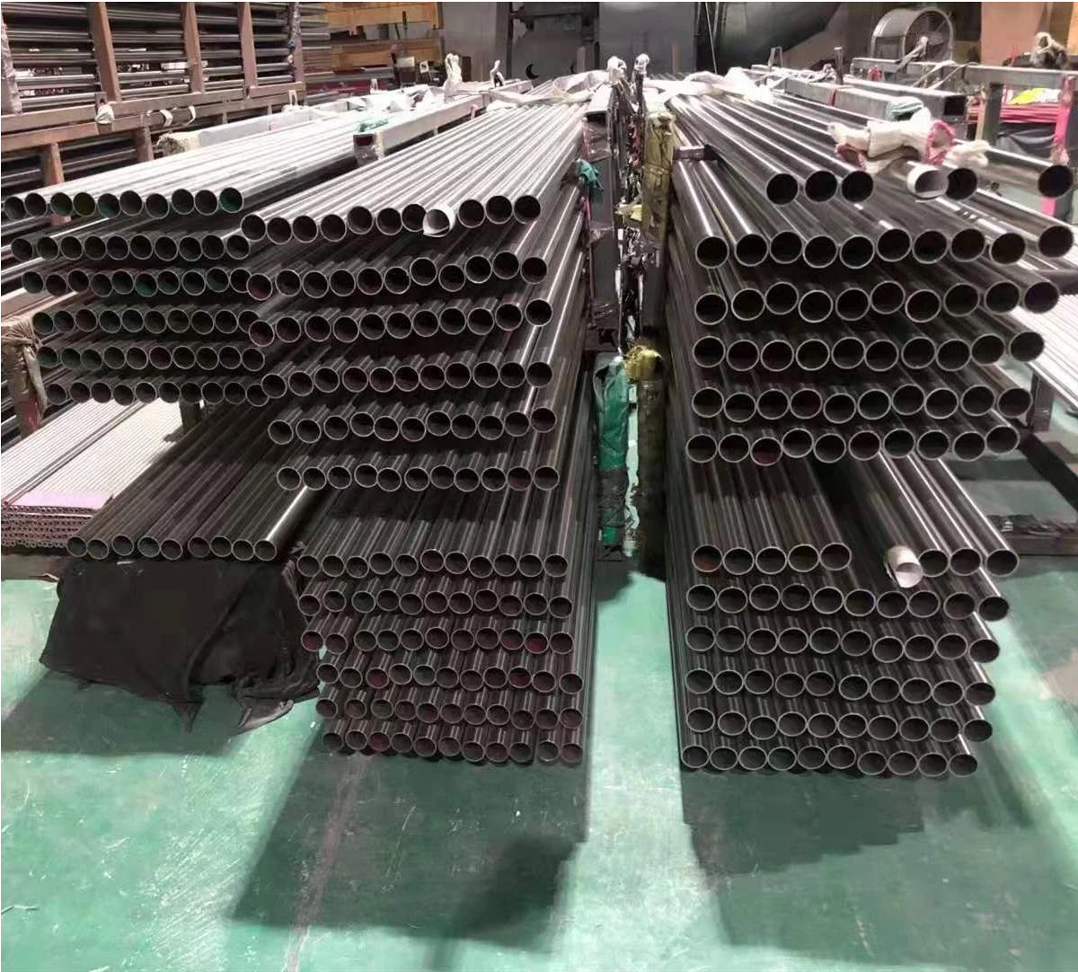
Black Pulver Coating Edelstahl-Balustrade-Rohrleitung