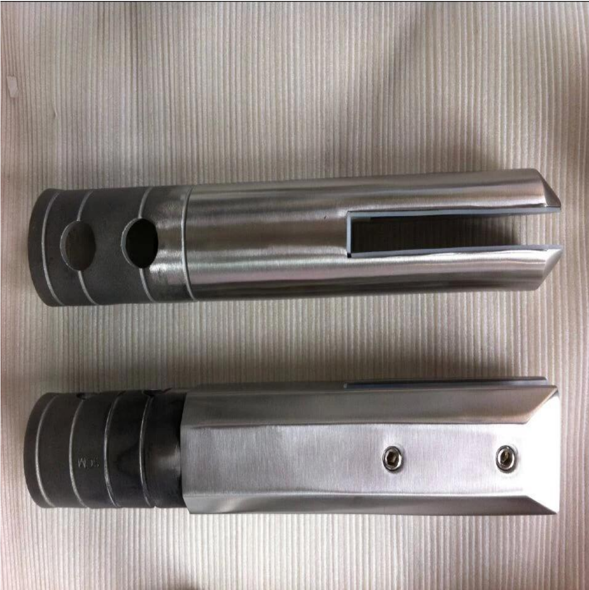
3.5mm Post mit Abdeckring