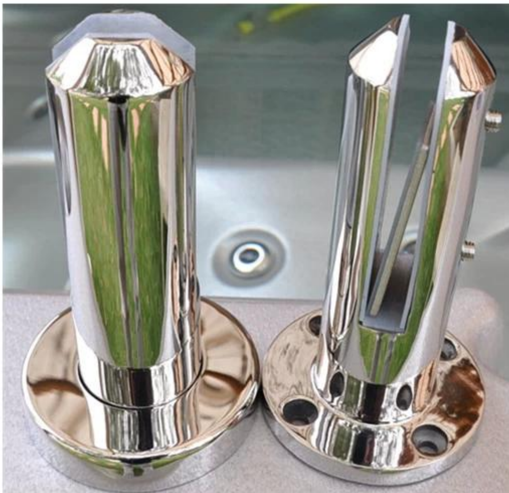
mirror finish glass spigot

1.Base Platte mimi veröffentlichen Eckiger in Spiegelglanz