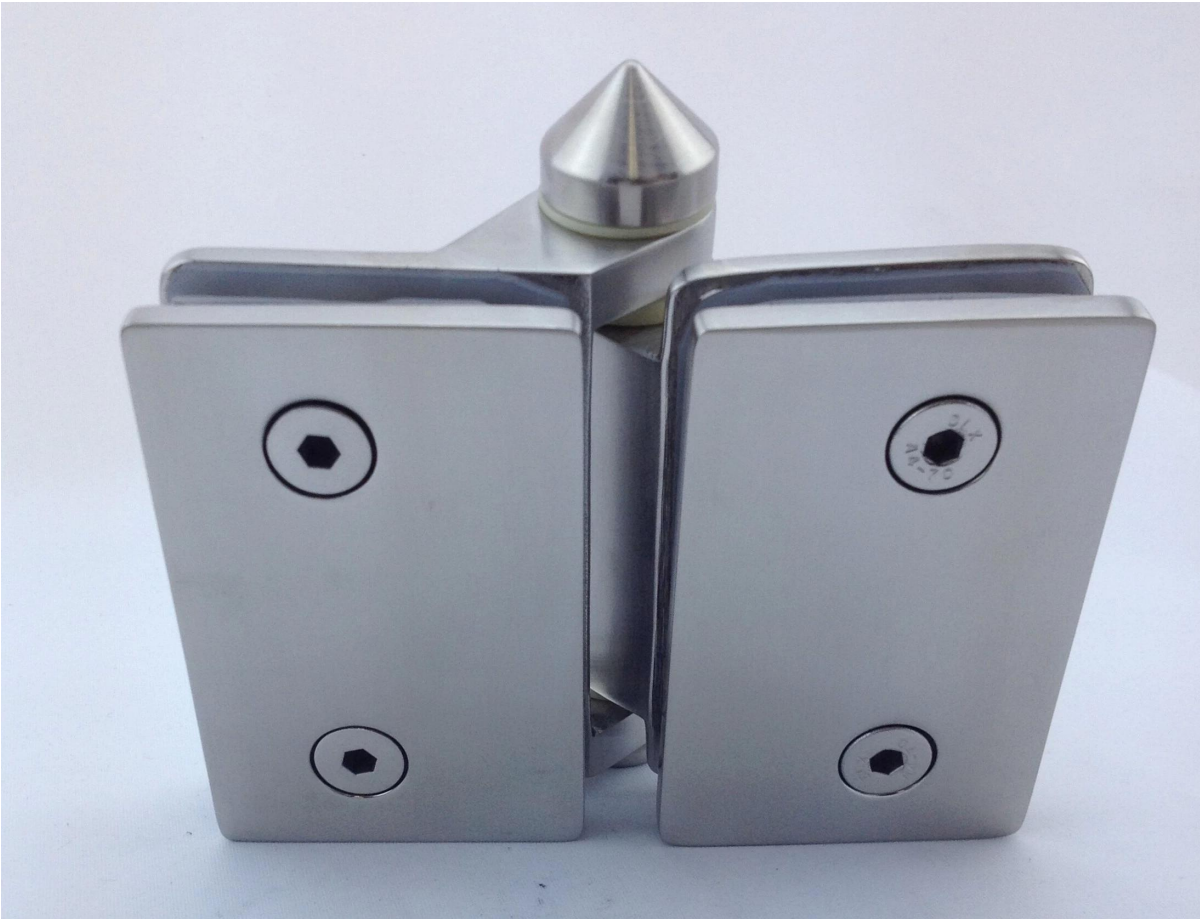
Gebohrte Löcher Glasgröße und position