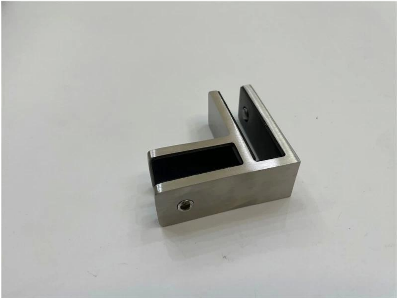
Kleine M8-Schrauben mit Kunststoffende für die Glasklemme