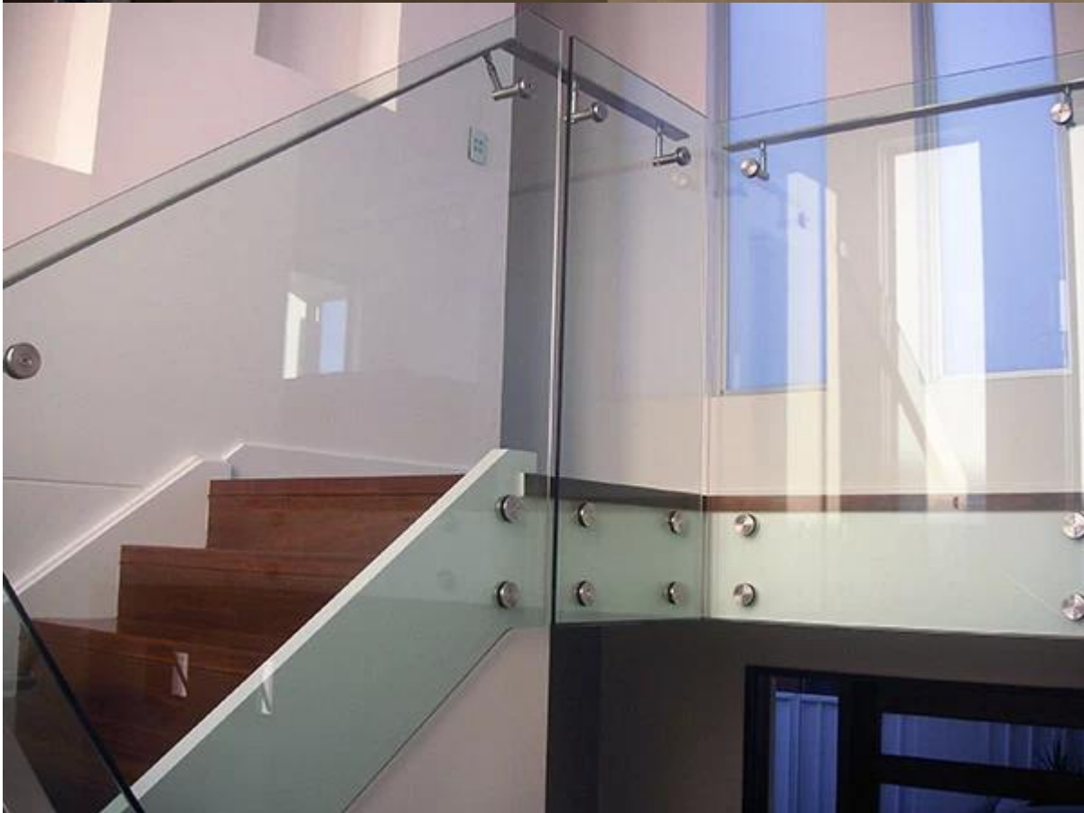
Für rahmenlose Glaszaun, wir haben ein anderes Design verwendet Glaszapfen Grundplatte Glashalter, rahmenlose Glaszapfen, runde Glaszapfen auf dem Boden