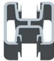
Square 2 way 180 degree