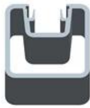
Square 1 way