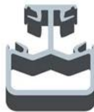
Square 2 way 135 degree