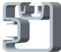
Square 2 way 90 degree