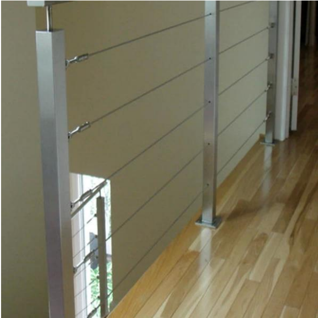
verschiedene Entwürfe für Ihre Wahl