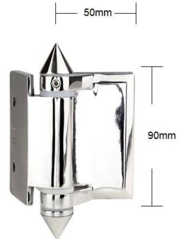
Part # G-W