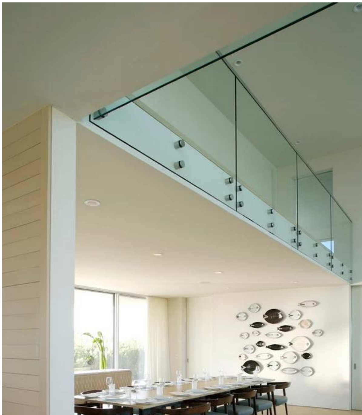
4. Glasgeländer Hardware Edelstahl Standoff Halter Modell No.SF-50T : javascript: void (0); / * 1469851036100 */