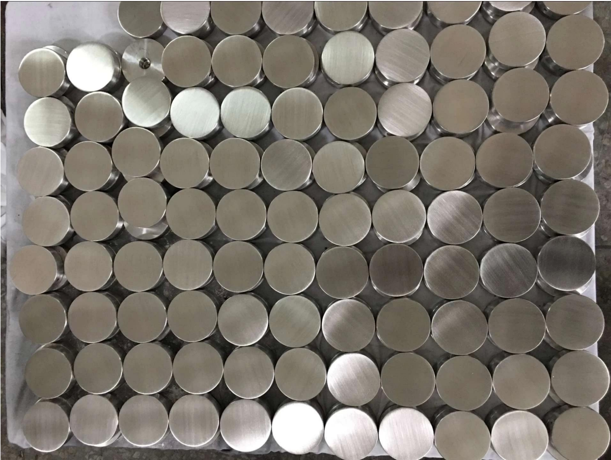
Glasabstand-Durchmesser 50 x 50mm Körper: