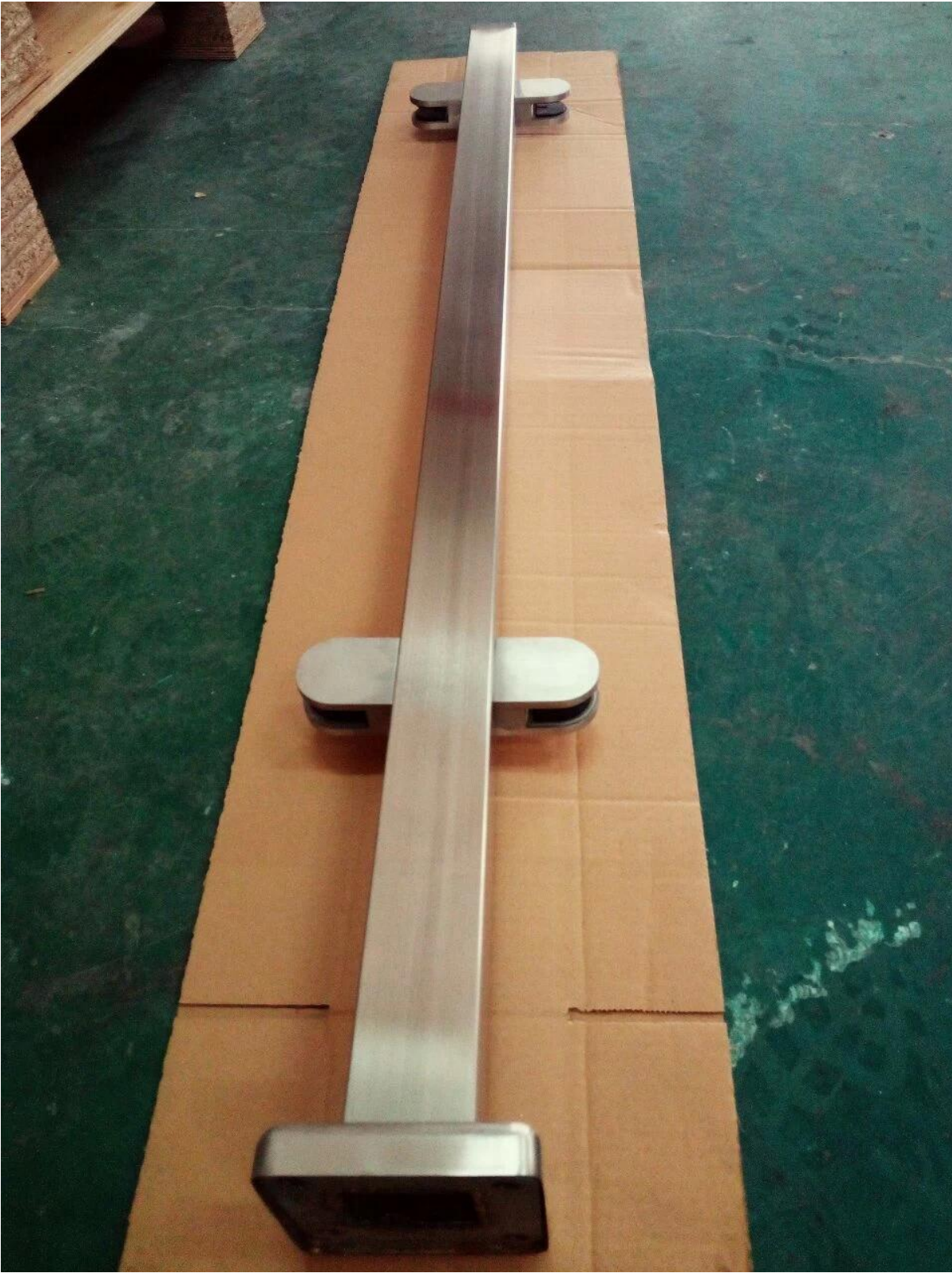
Fotos von gehärtetem Glas