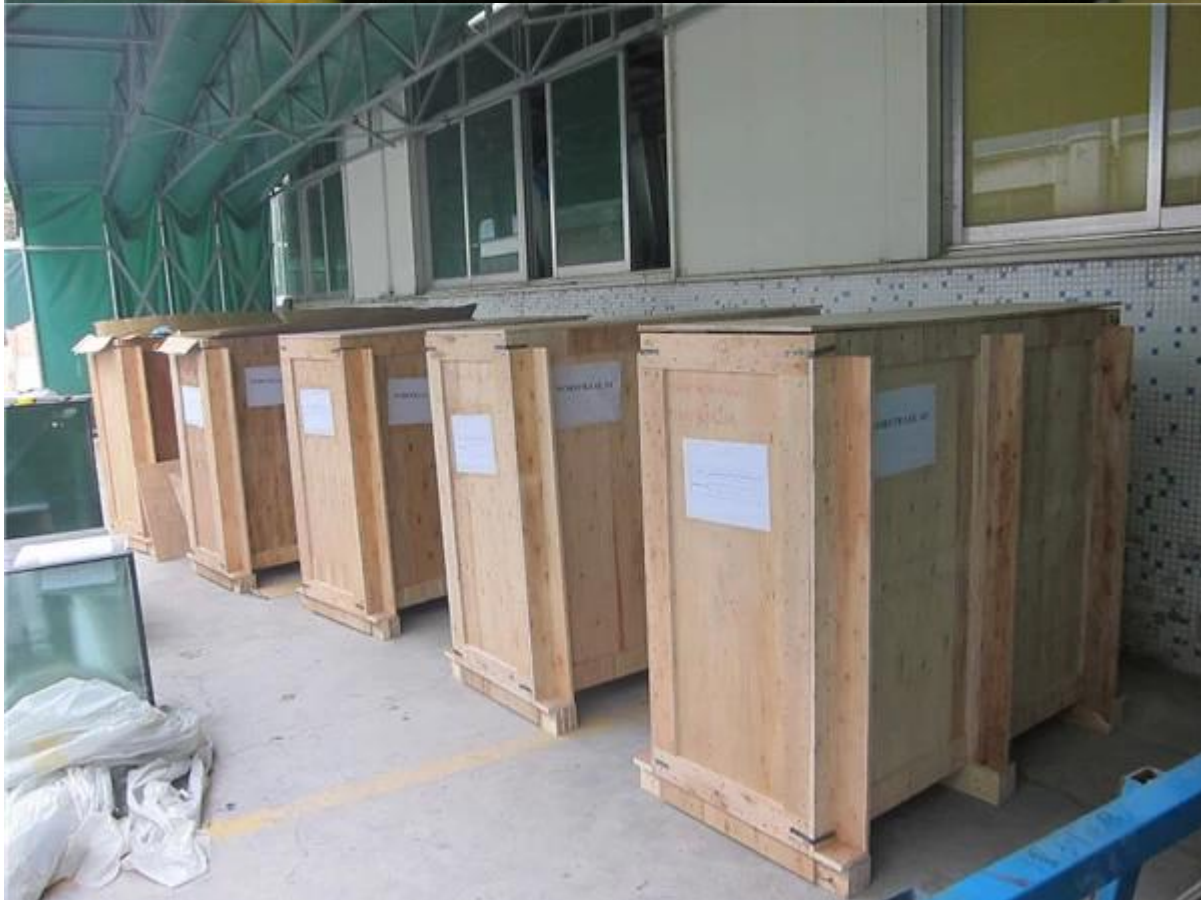
Projektfotos des Treppengeländerdesigns, Edelstahl-Glasgeländer-