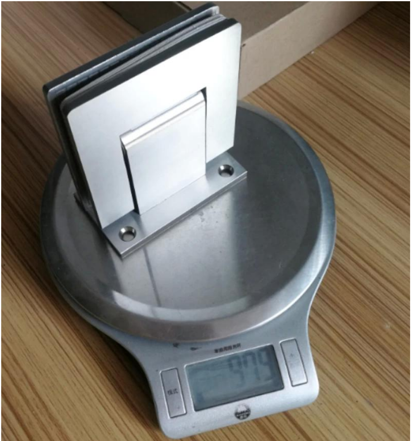
90 Grad & 180 Grad Glastürscharnier mit Edelstahlmaterial -