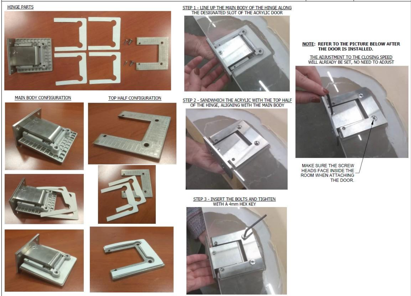
Verpackungsfotos von Glastürscharnieren