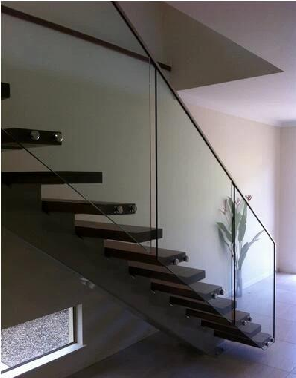
(3) im freien decking Glasprojekt Geländer